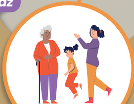
Enfoque de Género