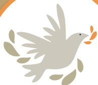
Cultura de Paz