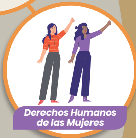
Derechos Humanos de las Mujeres